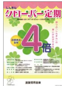
しんきんクローバー定期チラシ

去る平成24年3月15日、遠賀信用金庫の取引先である医療法人が計画する「病院・高齢者向け賃貸住宅等」の建設資金の対応をグループの4金庫に加え、信用金庫の中央機関である信金中金が参加し、総額31億円の大型の協調融資を行う計画を発表いたしました。