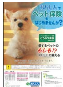
ペット保険チラシ

なお、今後の取組みとしては、事務用品やその他備品の共同調達による、コストダウンや事務処理・各種帳票の統一化による効率化を図るほか、お客様への安定的なご融資を目指した新商品の開発を行うなど、地域の活性化に向けた様々な取組みを図ってまいります。