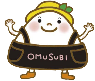
おんしん おむすび会 イメージキャラクター 「おむすびくん」

「おんしん おむすび会」会員の皆さまには、たくさんの素敵な特典がございます。どうぞ、お気軽に皆さまのお近くにある営業店の窓口へお声をかけてください。